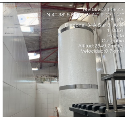
Foto No.5. Tanque sedimentador

Como parte del operativo de control desarrollado en conjunto con la Empresa de Acueducto y Alcantarillado de Bogotá EAAB – ESP, se verificó que las aguas residuales no domésticas provenientes del proceso productivo son descargadas en la caja de inspección externa ubicada sobre la DG 34A SUR (Ver Foto No. 6), mientras que las aguas residuales domésticas son dirigidas a la caja de inspección externa de la TV 81B (Ver Foto No. 7). No obstante, el personal de la EAAB informó que por un periodo de tiempo se observó la descarga de los vertimientos no domésticos en ambas cajas de inspección, por lo tanto, se requirió al usuario realizar las adecuaciones necesarias. Durante la visita técnica, se verificó que la situación fue corregida y actualmente solo cuentan con un punto de descarga para los vertimientos generados en el desarrollo de la actividad productiva, el cual está ubicado en la DG 34A SUR.