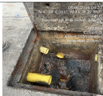
Foto No.7. Caja de Inspección Externa TV 81B - ARD

El usuario presentó certificado de recolección y disposición de subproductos (vísceras, lodos líquidos, plumas, menudencias) por parte de la empresa PROTEICOL S.A.S. del día 01/04/2024. Sin embargo, durante la inspección se evidenció la disposición directa de plumas y agua sangre en el sumidero pluvial ubicado frente al predio, así como vertimientos hacia el espacio público, producto de su actividad económica (Ver Foto No. 8 y 9).