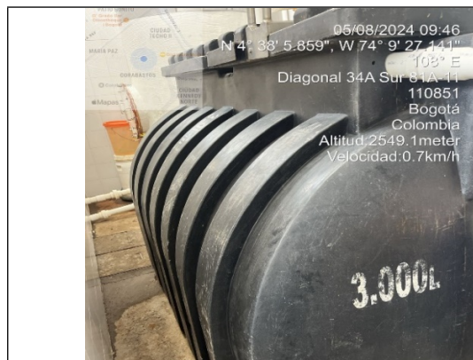
Foto No.4. Tanque de floculación